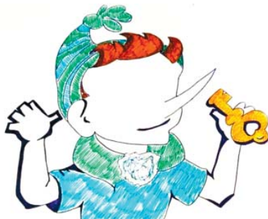
Рис. П2.3. Пример «Буратино»